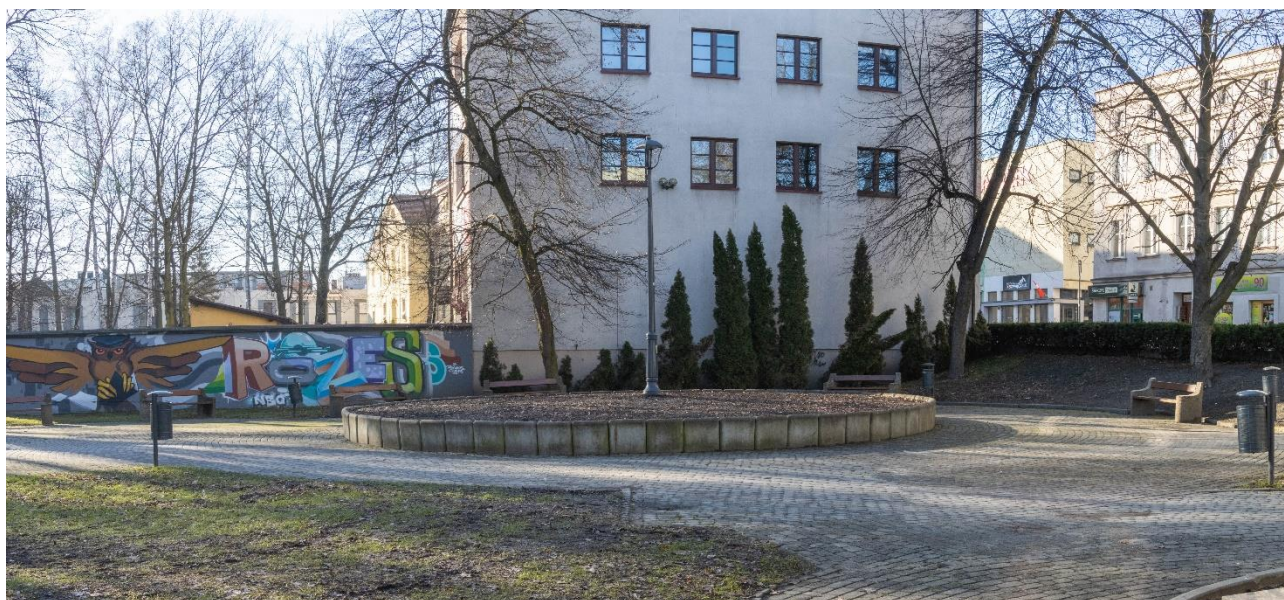
Skwer na granicy Parku Zamkowego i ulicy ks. płk. Wilhelma Kubsza

Jest takie wyjątkowe miejsce na Starym Mieście, które zasługuje na dłuższą refleksję i w efekcie tej na dużą metamorfozę. To skwer usytuowany w Parku Zamkowym, graniczący z ulicą ks. płk. Wilhelma Kubsza, niezwykle często uczęszczany lub właściwie przemierzany przez ludzi, bo znajdujący się na szlaku komunikacyjnym centrum handlowe-Park Zamkowy-ulica Kubsza (docelowo deptak Kubsza). Obecnie w tej lokalizacji znajdują się m.in. okrągły, sporych rozmiarów kwietnik, uzupełniany jedynie o sezonowe nasadzenia, a także już nieatrakcyjne ławki, które najlepiej byłoby wymienić. Przygotowana koncepcja zakłada naprawdę spore zmiany w tej lokalizacji. I nie chodzi tu tylko o estetykę przestrzeni, ale i sposób jej wykorzystania przez mieszkańców i osoby odwiedzające Wodzisław Śląski.