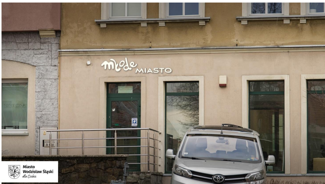
Wizualizacja szyldu Młode Miasto na elewacji kamienicy na Rynku 24

Dlaczego powstaje Młode Miasto? Tak naprawdę jest ono efektem bardzo owocnych i inspirujących rozmów, jakie zostały przeprowadzone z wodzisławską młodzieżą, m.in. podczas zorganizowanych przez miasto paneli dyskusyjnych w Pałacu Dietrichsteinów. Rozmowy te dotyczyły i właściwie nadal dotyczą oczekiwań młodych, potrzeb, pomysłów, propozycji zmian, w tym konkretnych inicjatyw związanych np. z edukacją, czasem wolnym, wydarzeniami czy zdrowiem, również tym, dziś w kontekście młodzieży tak ważnym, psychicznym. Młodzi wodzisławianie biorący udział we wspomnianych spotkaniach pokazali i wtedy, i pokazują też nieustannie swą wielką mądrość, dojrzałość i otwartość. Właśnie z uwagi na te wszystkie przeprowadzone rozmowy i zorganizowane spotkania, w większym gronie i indywidualnie, miasto wyszło do nich z tą całkiem nową ofertą. Ofertą, na którą składa się nie tylko zlokalizowana na Starówce strefa młodzieży, której otwarcie zaplanowano na marzec 2024 roku, ale i cała sfera różnego rodzaju działań do niej skierowanych, także poza tym miejscem.