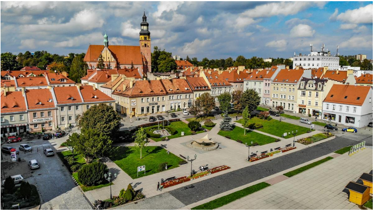
Wodzisławski rynek z lotu ptaka.

Koncepcja zmian na starówce zakłada uporządkowanie historycznego rynku i pełnionych przez niego funkcji poprzez kilka głównych działań. Po pierwsze: poprzez podział na kilka „stref”, dokładnie cztery: historyczno-informacyjną, rekreacyjno-wypoczynkową, wydarzeń i usługowo-gastronomiczną. Po drugie: poprzez wyznaczenie głównej ścieżki „pieszej” (co mogłoby mieć odwzorowanie w ciemniejszym kolorze kostki brukowej) od północno-zachodniego wejścia w stronę południowo-wschodnią, czyli w kierunku Pałacu Dietrichsteinów oraz docelowo deptaka i dalej woonerfu w ciągu ulicy Kubsza (więcej informacji o deptaku i woonerfie w kolejnych fragmentach opracowania). Po trzecie: poprzez spore zazielenienie wybrukowanej w całości płyty, ale z zachowaniem tak ważnej funkcji placu. Z wymienionymi działaniami związane byłyby: wymiana asfaltowej nawierzchni na brukową (z uwzględnieniem miejsc na tzw. szpilkostrady, czyli traktów, po których z większym ułatwieniem mogłyby poruszać się np. osoby niepełnosprawne, rodzice z wózkami dziecięcymi czy kobiety w butach na wysokim obcasie), właściwa zmiana geometrii nawierzchni utwardzonych (z uwzględnieniem wyrównania płaszczyzny w miejscu przebiegającej obecnie przez środek rynku drogi, w tym momencie nieuczęszczanej przez samochody). Do ogólnego opisu warto dodać, że w północnej części rynku zachowane miałyby zostać obecne miejsca parkingowe, a na całym obszarze zamontowane w ostatnich latach latarnie.