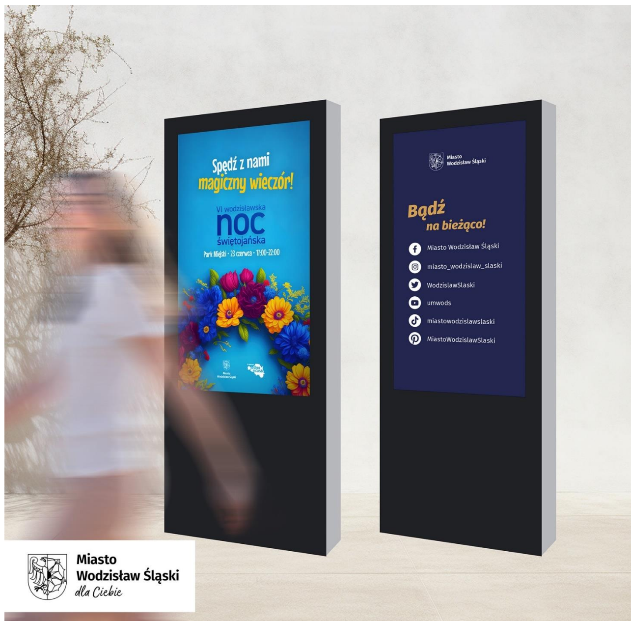
Wizualizacja totemów informacyjnych objętych Systemem Informacji Miejskiej

fontanny; przy wejściu na przywołany w poprzednim zdaniu skwer, a także dodatkowo w Parku Zamkowym – w okolicy dworca autobusowego, który ma stanąć w pobliżu galerii handlowej (od strony parku) w ramach zaplanowanej dzięki środkom wynegocjowanym z Funduszy Europejskich dla Śląska 2021-2027 rozbudowy Centrum Przesiadkowego w Wodzisławiu Śląskim.