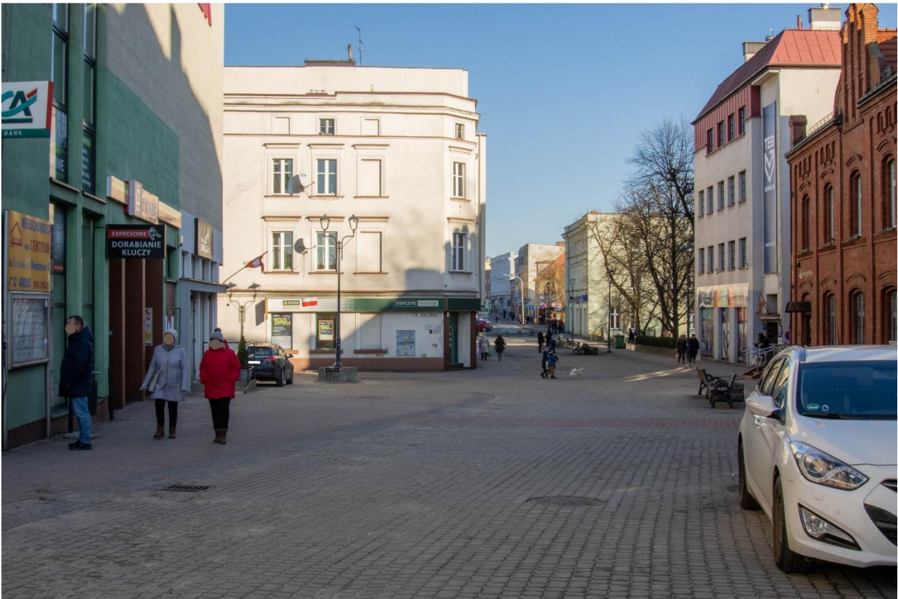
Fragment ulicy ks. płk. Wilhelma Kubsza