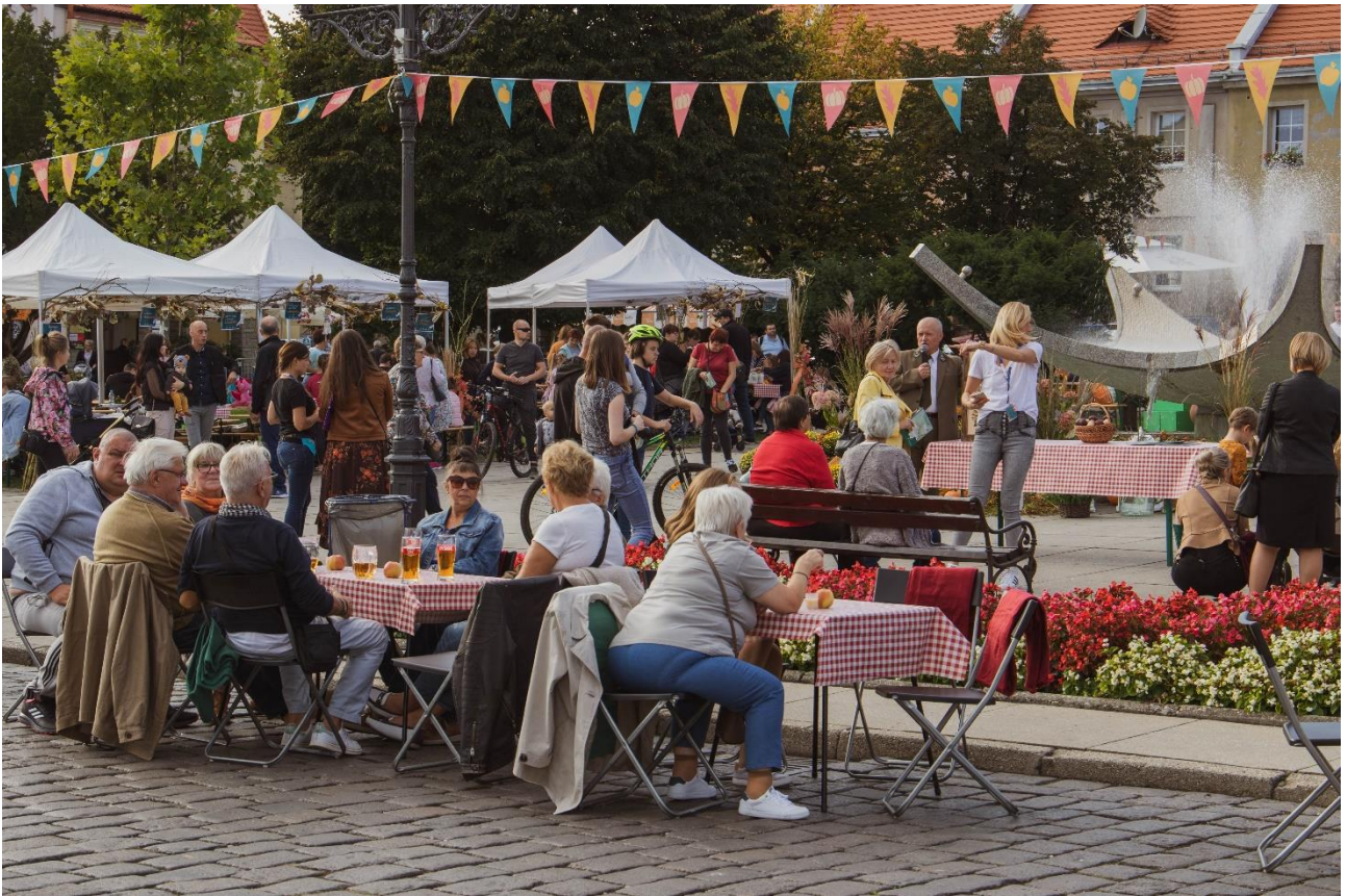
DzieJesie(ń) Festiwal – jedna z dotychczasowych edycji

Czy jakieś zmiany do repertuaru obecnych imprez można by wprowadzić, by wpłynąć na uatrakcyjnienie starówki i częstsze jej odwiedzanie przez wodzisławian i turystów? I nie jest tu mowa tylko o rynku, ale i o wszystkich miejscach w otoczeniu, również tych, którym w ramach tej koncepcji nadano nowe funkcje, m.in. deptaku i woonerfie w ciągu ulicy Kubszą, skwerze Park Zamkowy/Kubsza czy miniwoonerfach na poszczególnych uliczkach, a także o Pałacu Dietrichsteinów. Odpowiedź jest prosta: oczywiście, że zawsze można. Kilka możliwych do podjęcia przykładów działań można znaleźć poniżej. Świetnie, gdyby stały się inspiracją przy kreowaniu kolejnych wydarzeniowych realizacji.