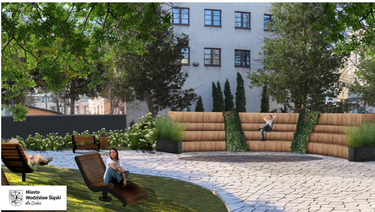
Wizualizacja skweru na granicy Parku Zamkowego i ulicy ks. płk. Wilhelma Kubsza