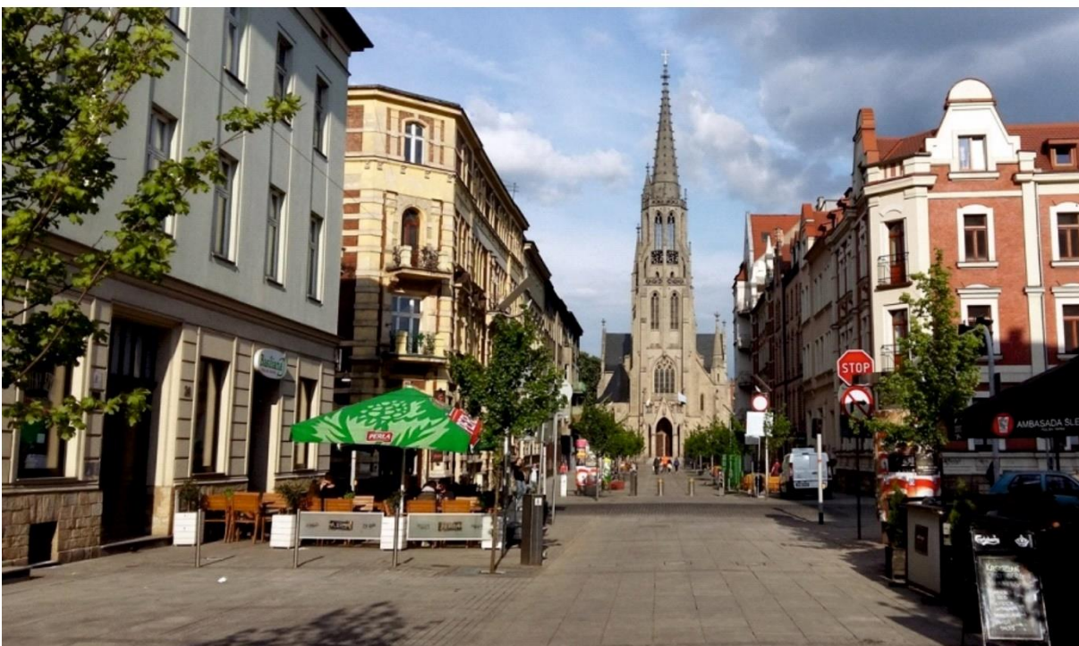
Inspiracja: woonerf w Katowicach – przed i po zrealizowaniu inwestycji.