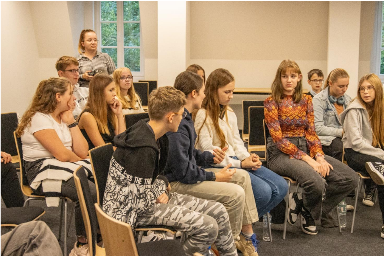
Młodzież podczas jednego z paneli dyskusyjnych w Pałacu Dietrichsteinów w 2023 roku

Nad konceptem Młodego Miasta, nową siedzibą młodych w samym centrum Wodzisławia Śląskiego i kontaktem na linii miasto-młodzi ma czuwać pełnomocnik prezydenta miasta ds. młodzieży. Specjalnie przygotowane z myślą o młodych pomieszczenia na Rynku mają być punktem spotkań młodzieży z terenu Wodzisławia Śląskiego oraz powiatu wodzisławskiego. Przestrzenią, w której młodzi mieszkańcy wydrukują potrzebne materiały, przećwiczą prezentację, wypiją dobrą kawę. Pełnomocnik właśnie, pracując w Młodym Mieście, ma ich w tych aktywnościach wspierać. W strefie na Rynku 24 ludzie będą mogli swobodnie spędzać czas wolny, integrować się z rówieśnikami, realizować swoje pasje i talenty, rozmawiać o emocjach, zgłaszać pomysły dotyczące przestrzeni miasta i odbywających się na jego terenie wydarzeń. Będzie to także miejsce współpracy między szkolnymi samorządami, co w założeniu ma dać podwaliny pod młodzieżową radę miasta. W Młodym Mieście będzie tworzona i poszerzana świadomość obywatelska. Młodzi uzyskają pomoc w poznawaniu lokalnych przedsiębiorców i rynku, będą mieć możliwość udziału w ciekawych spotkaniach z twórcami i warsztatach, np. z zakresu autoprezentacji czy kompetencji miękkich.