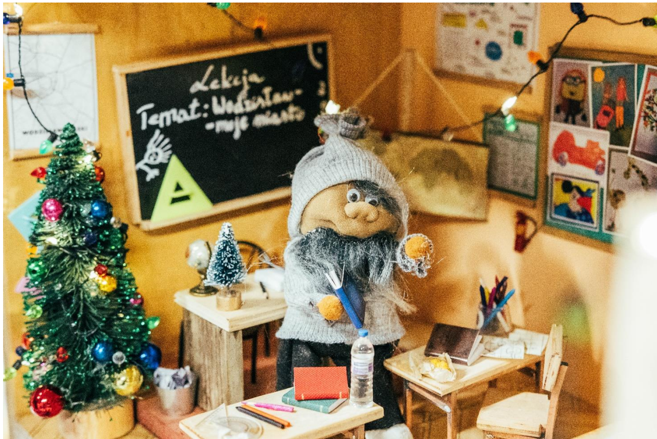
Wodzisławskie Skrzaty – jedna z instalacji na starówce

Patrząc na potencjał turystyczny miasta i duże zainteresowanie Wodzisławskimi Skrzatami, które swoje domy znalazły właśnie w obrębie starówki, można by zrealizować więcej stałych wydarzeń związanych z tą „skrzacią” tematyką. Być może np. regularnie organizowane zwiedzanie starówki dla najmłodszych i rodzin, połączone z odwiedzaniem miejsc „zajętych” przez Wodzisławskie Skrzaty. Pomysłów jest wiele.