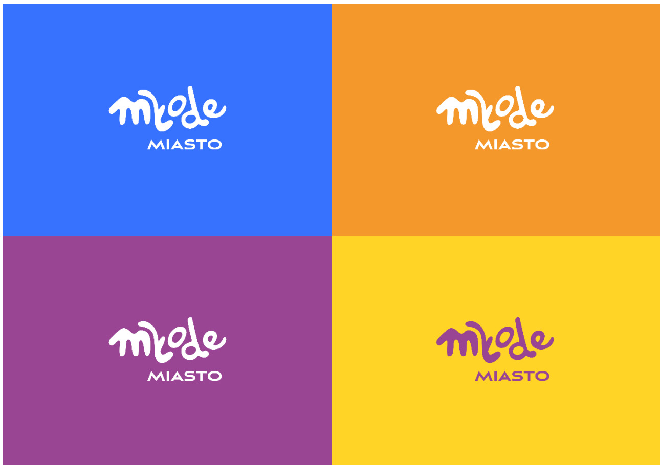
Nowy znak graficzny Młode Miasto