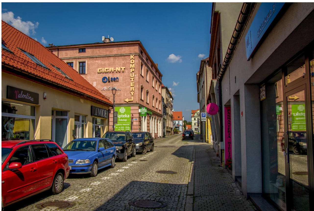
Ulica Księżnej Konstancji na Starym Mieście

Idea woonerfu w przyszłości mogłaby zostać wprowadzona nie tylko na ulicy Kubsza, ale i w innych miejscach na terenie Starego Miasta. Miniwoonerfy w przyszłości mogłyby zostać utworzone na staromiejskich ulicach Powstańców Śląskich, Średniej, Księżnej Konstancji i Minorytów.