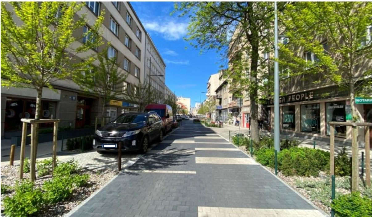
Inspiracja: woonerf w Gdyni – przed i po zrealizowaniu inwestycji.