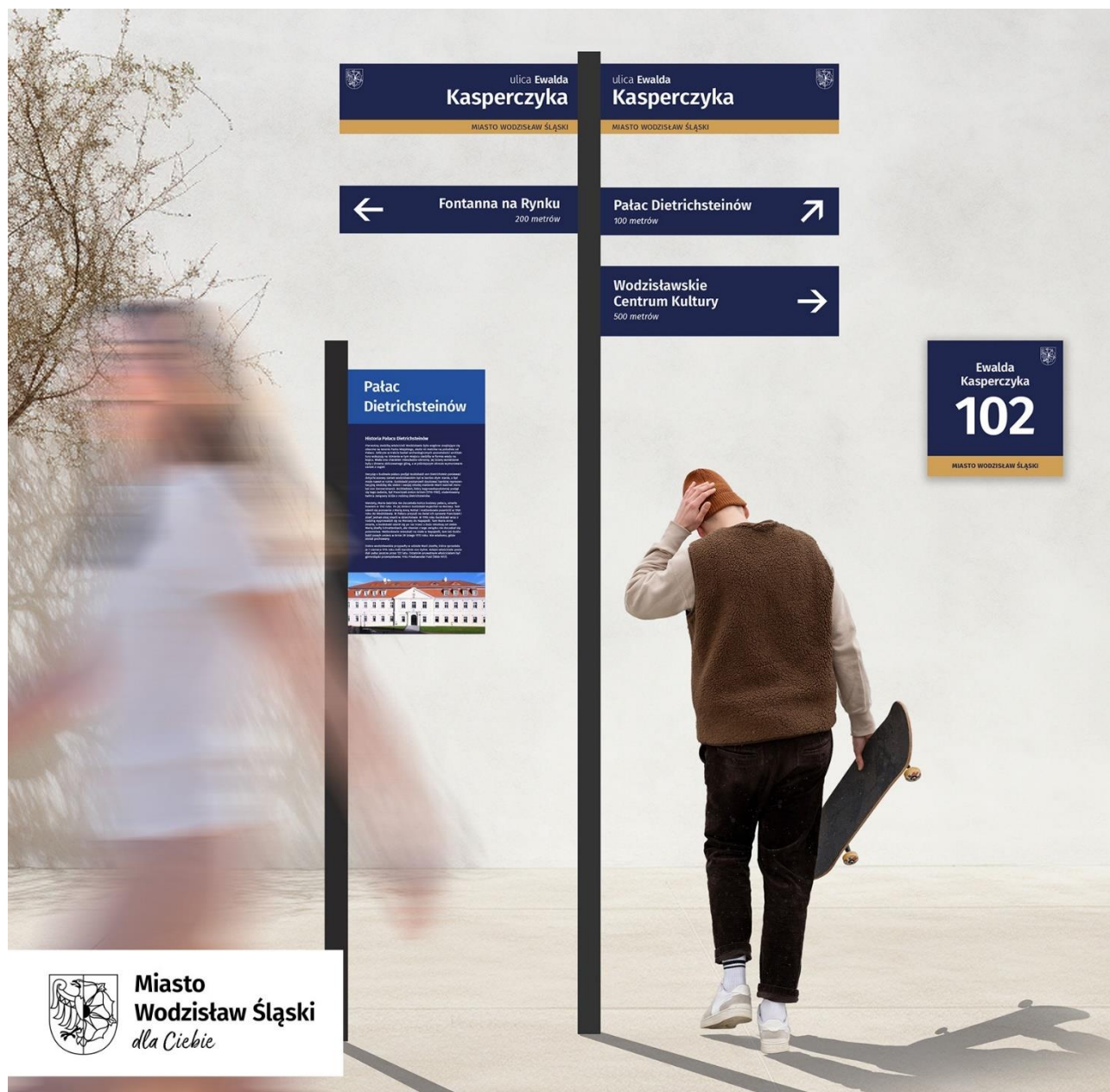
Wizualizacja tablic objętych Systemem Informacji Miejskiej

poniżej) wodzisławianie i inni użytkownicy przestrzeni starówki i później kolejnych obszarów miasta będą mogli się łatwiej w niej odnaleźć. To niezwykle ważne. Ale to nie jedyne plusy. SIM bezsprzecznie poprawia estetykę miasta i jest nieocenionym wsparciem prowadzonych przez miasto działań promocyjnych.